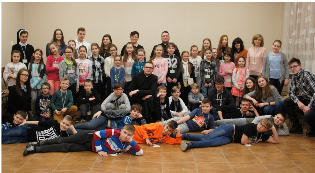
Zdjęcie grupowe z półkolonii przy Parafii Katedralnej

Wszystkim ofiarodawcom „Serdeczne Bóg zapłać”.